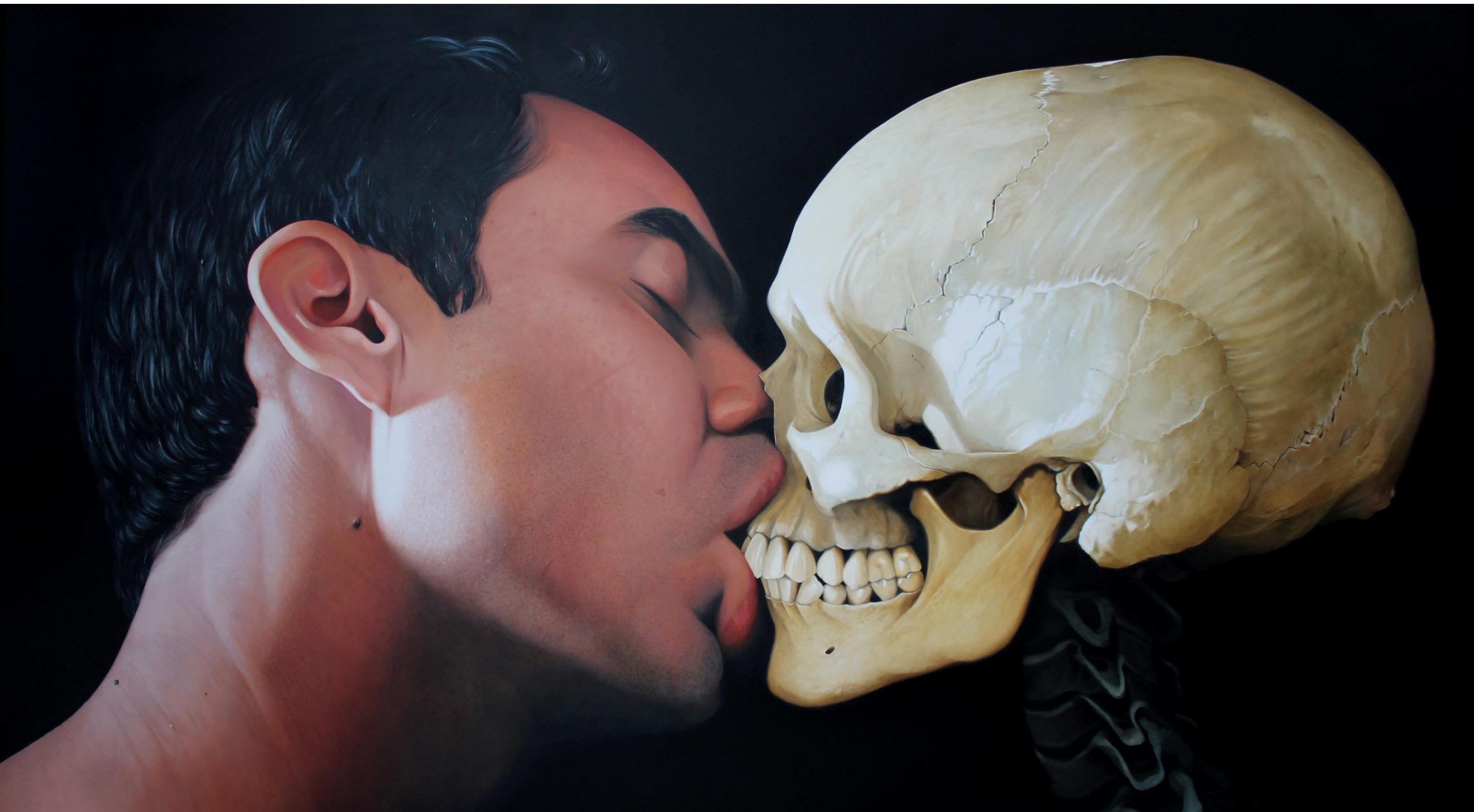
Fábio Magalhães / Encontro (Série Superfícies do Intangível) / Óleo sobre tela / 190 x 315 cm / 2014.