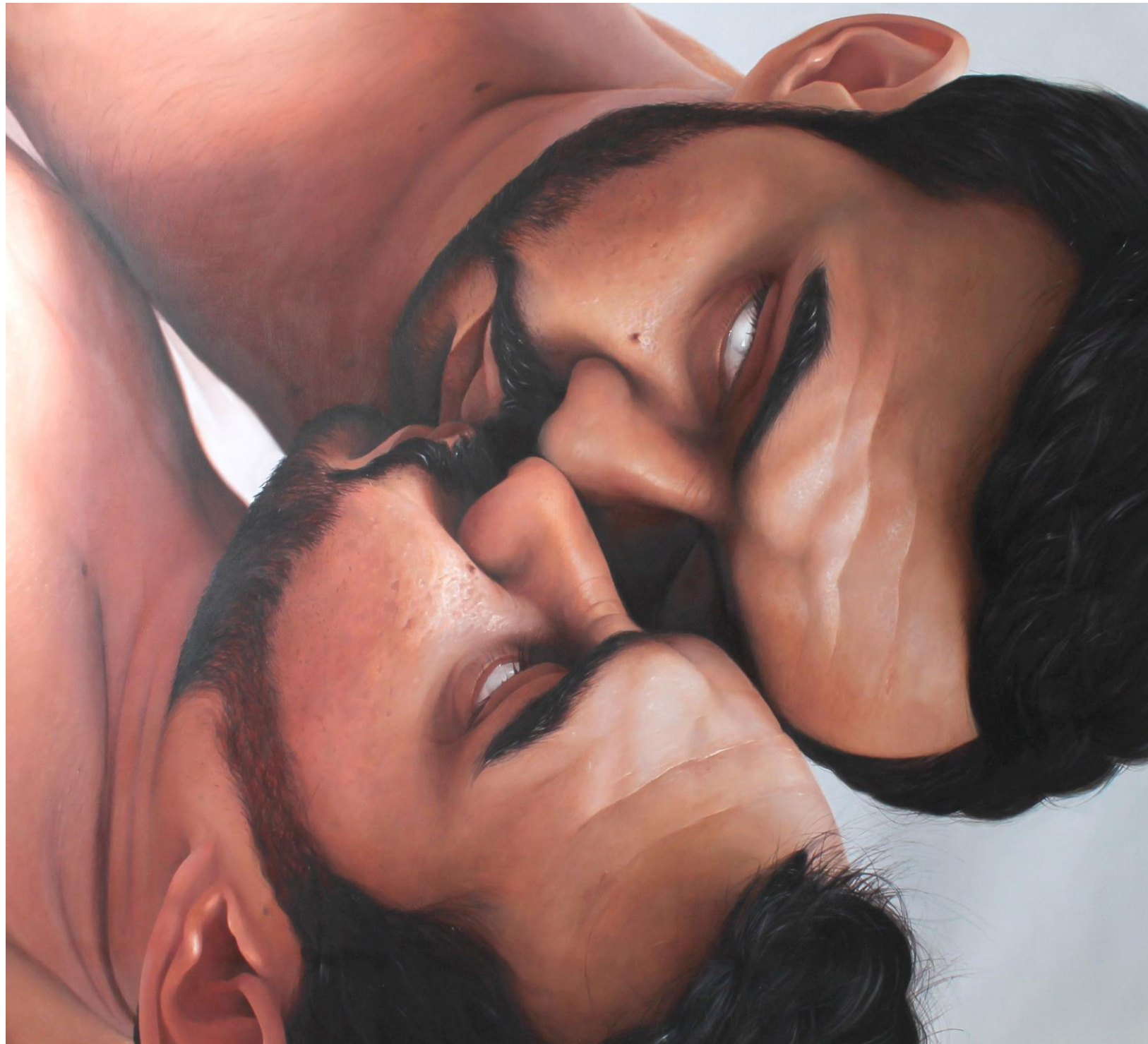
Fábio Magalhães / Encontro Impossível (Série Superfícies do Intangível) / Óleo sobre tela / 190 x 216 cm / 2014.