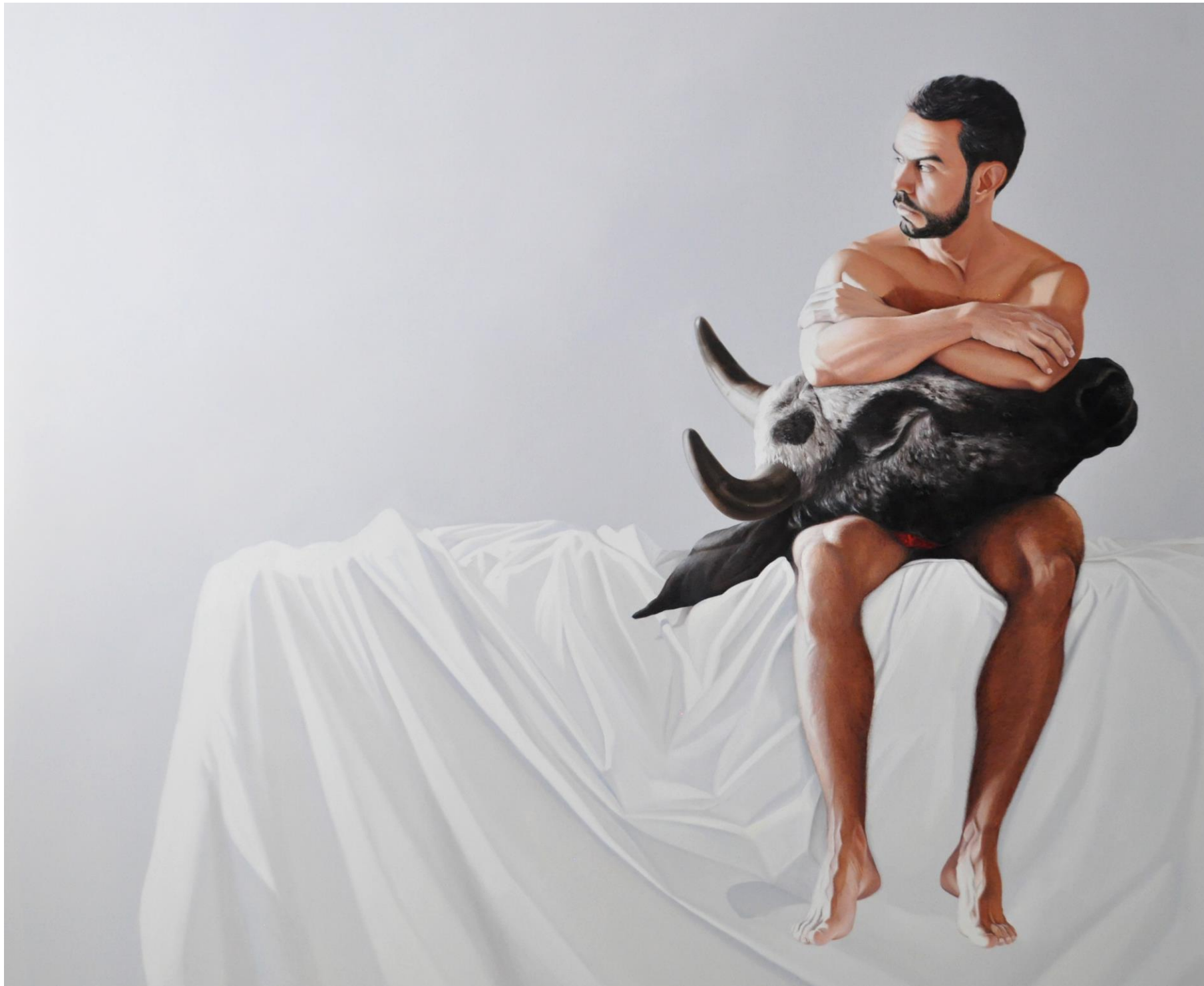
Fábio Magalhães / Cofres para Instintos Primitivos (Série Latências Atrozes) / Óleo sobre tela / 190 x 210 cm / 2015.