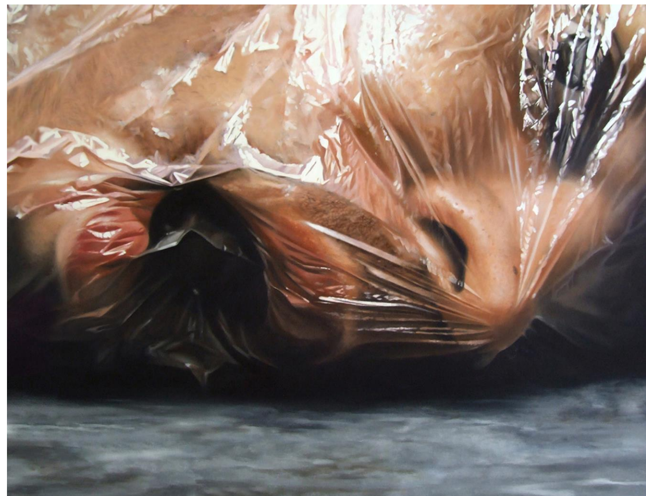
Fábio Magalhães / Próximo Segundo (Série O Grande Corpo) / Óleo sobre tela / 110 x 140 cm / 2010 / Coleção Particular.