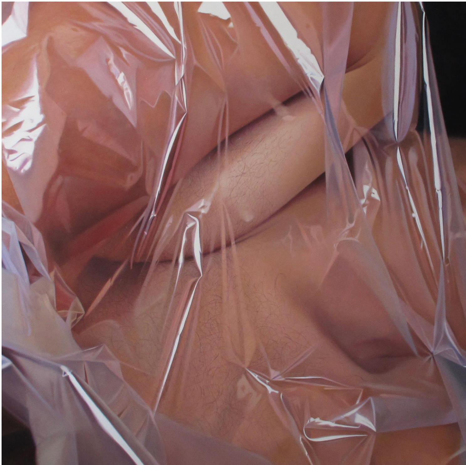
Fábio Magalhães / Invólucro V (Série O Grande Corpo) / Óleo sobre tela / 160 x 160 cm / 2011.