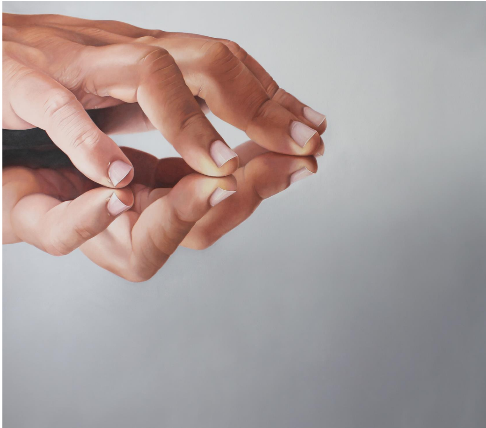
Fábio Magalhães / Afago (Série Superfícies do Intangível) / Óleo sobre tela / 190 x 210 cm / 2014.