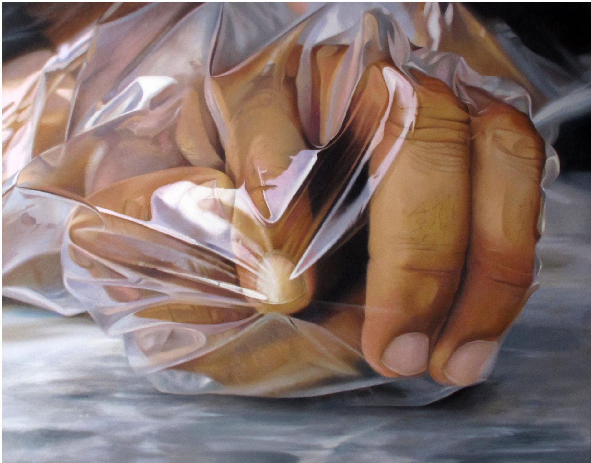
Fábio Magalhães / Invólucro II (Série O Grande Corpo) / Óleo sobre tela / 110 x 140 cm / 2008.