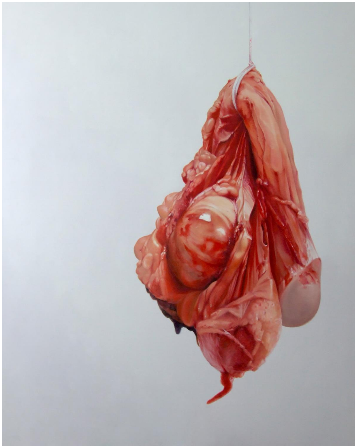
Fábio Magalhães / Sem título (Série Retatos Íntimos) / Óleo sobre tela / 190 x 140 cm / 2013 / Coleção Particular.