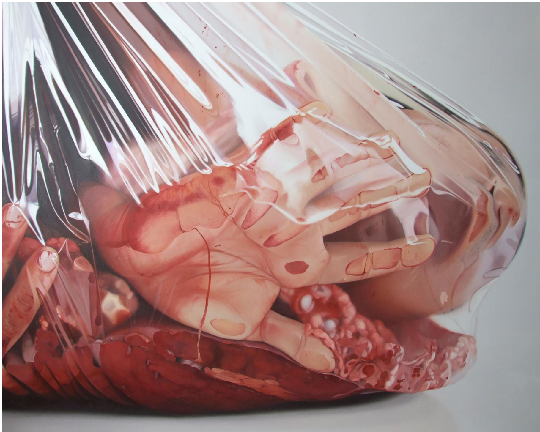
Fábio Magalhães / Touças II (Alusivo ao Artur Barrio) / Óleo sobre tela / 190 x 250 cm / 2013 / Coleção Particular.