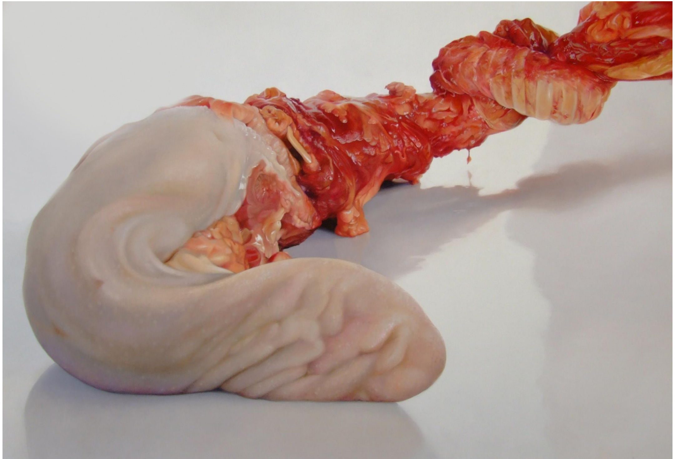
Fábio Magalhães / Sem título (Série Retatos Íntimos) / Óleo sobre tela / 140 x 190 cm / 2011 / Coleção Particular.