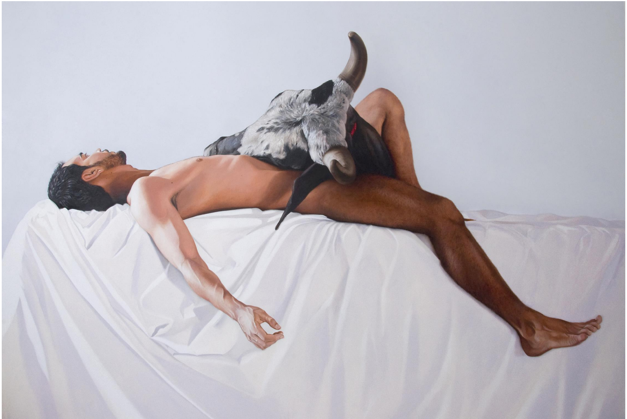
Fábio Magalhães / Em tempos de Incertezas o Devaneio é a via de fuga (Série Latências Atrozes) / Óleo sobre tela / 170 x 220 cm / 2015.