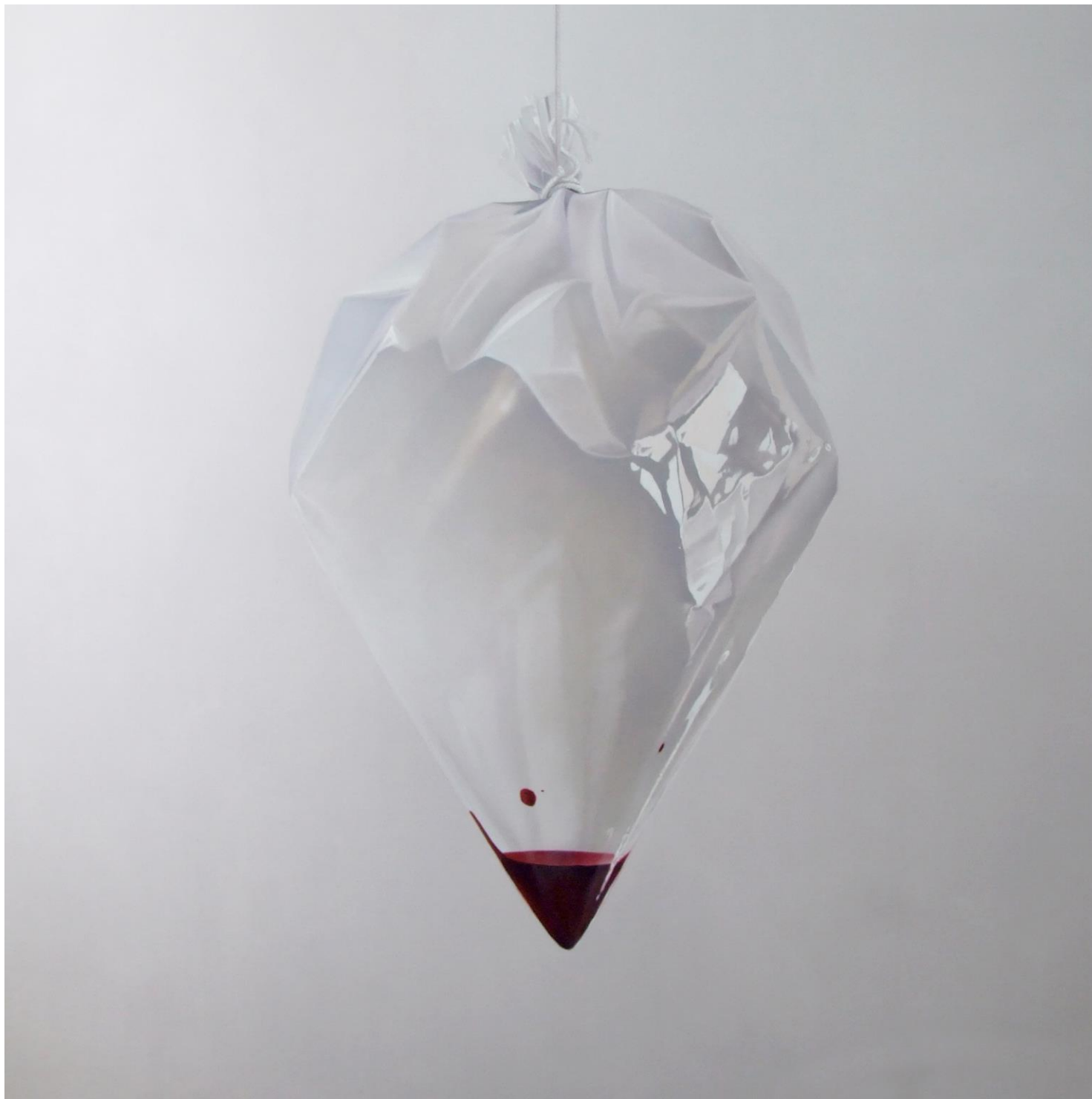
Fábio Magalhães / Sem título (Série Retatos Íntimos) / Óleo sobre tela / 190 x 190 cm / 2013 / Coleção Particular.