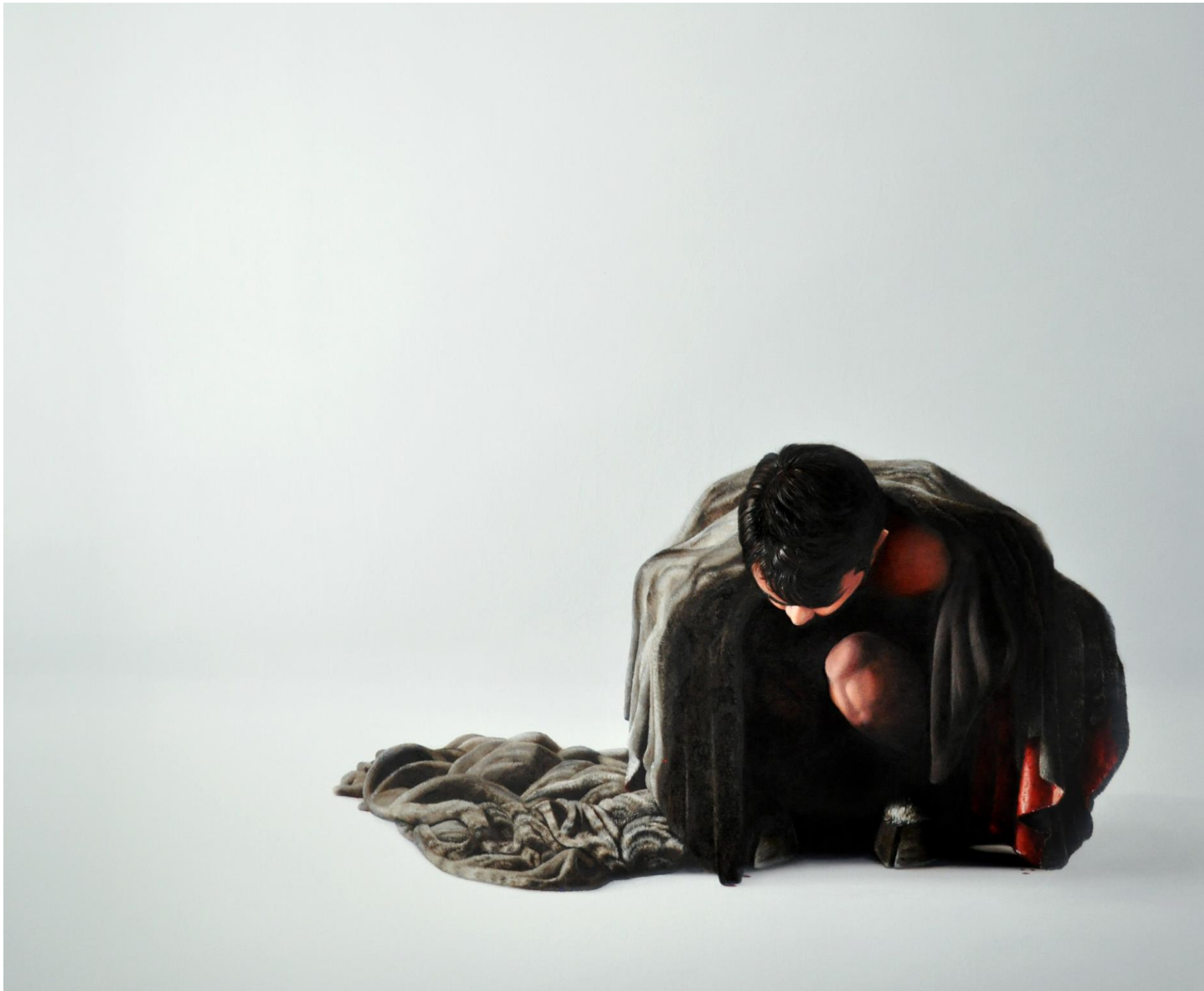
Fábio Magalhães / A Certeza é a prova da Dúvida (Série Latências Atrozes) / Óleo sobre tela / 190 x 230 cm / 2015.