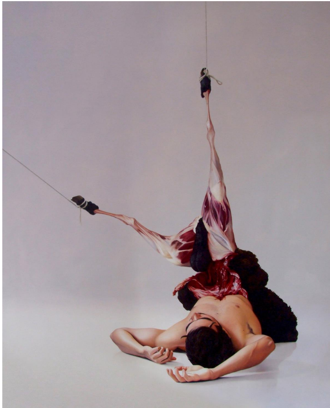
Fábio Magalhães / Onde Moram os Devaneios? / Óleo sobre tela / 230 x 210 cm / 2013 / Coleção Particular.